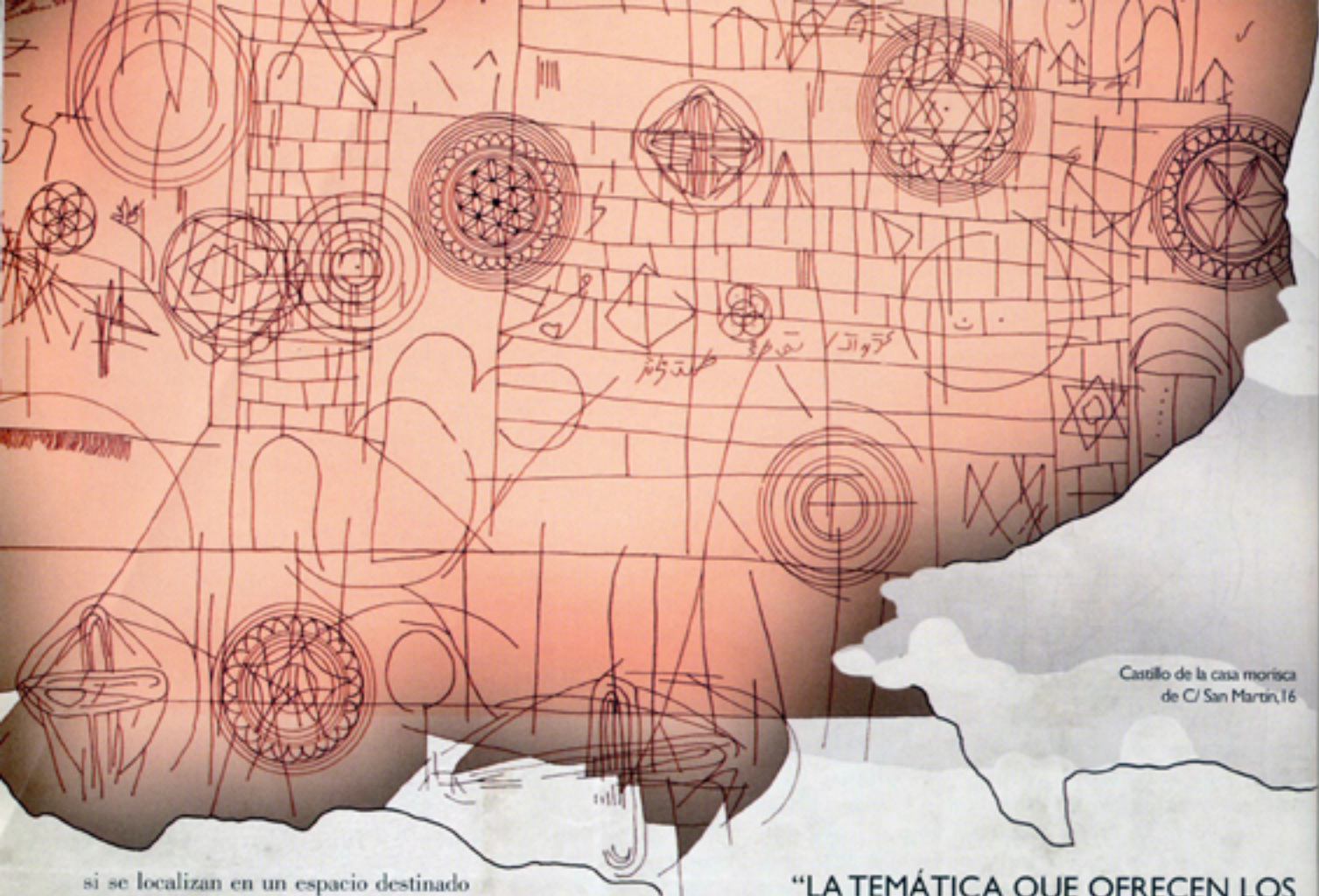
Castillo de la casa morisca de C/ San Martín, 16

si se localizan en un espacio destinado a recinto carcelario, la función de estas anotaciones sería el cómputo del tiempo de reclusión del cautivo, autor del grafito. Claros ejemplos de lo que decimos, son los localizados en la Torre del Homenaje de la Alhambra y en una de las estancias de la casa morisca de C/ San Martín, 16, en el barrio del Albayzín.