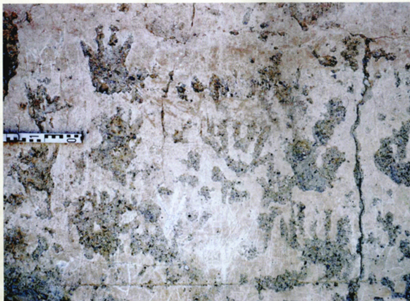
Manos repicadas en el tapial de la Torre de Cúllar

“EL GRAFITO HA PASADO DE SER CONSIDERADO UNA MANIFESTACIÓN MARGINAL, SIN INTENCIONALIDAD ALGUNA DE TRANSMITIR UN MENSAJE O UNA IDEA CONCRETA, A SER UN ELEMENTO IMPORTANTE ...”