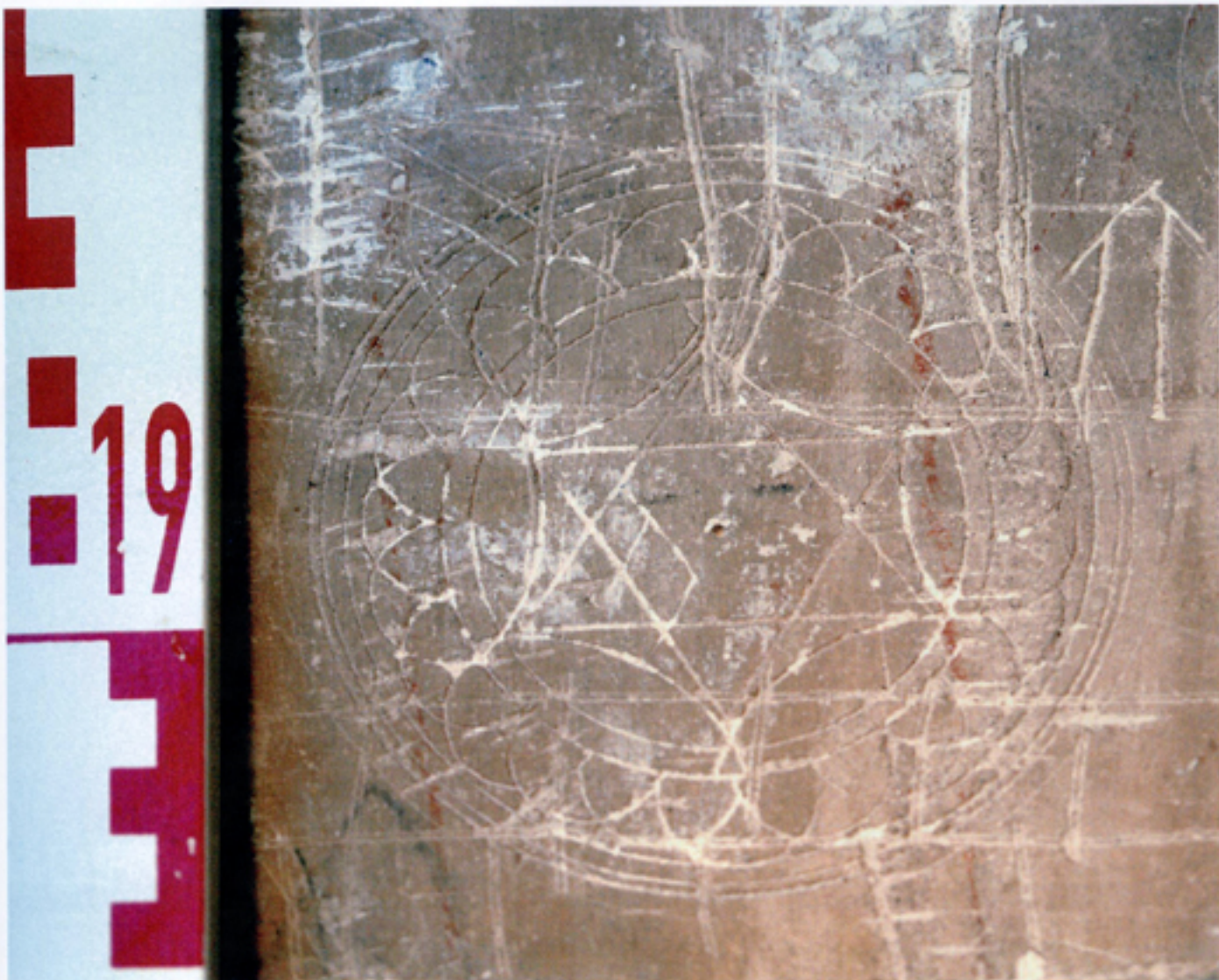
Diseño geométrico con Sello de Salomón en la casa de C/ San Martín,16