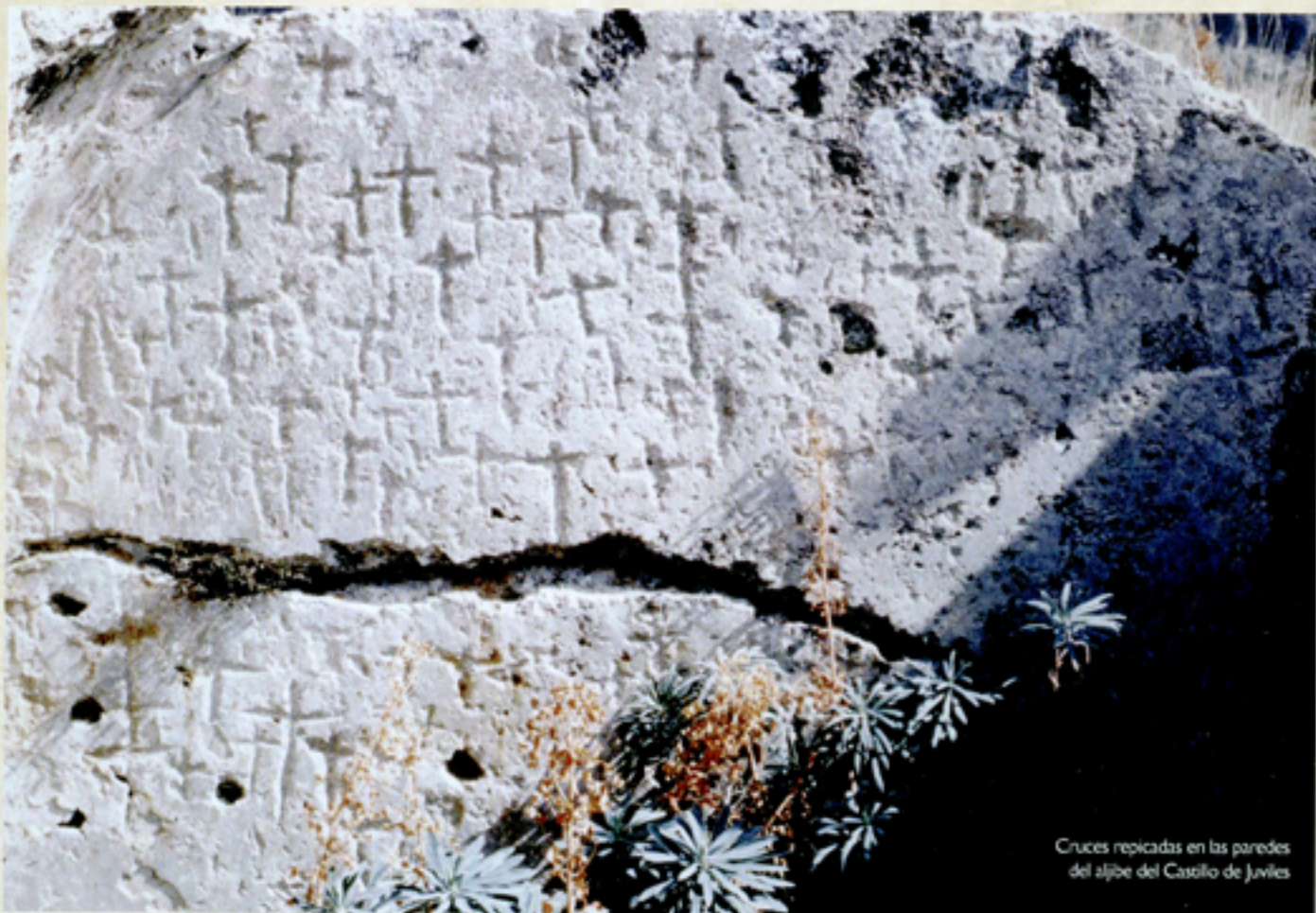
Cruces repicadas en las paredes del aljibe del Castillo de Juviles

“EL TRAZAR GRAFITOS DE CLARA TRADICIÓN ISLÁMICA NO TENÍAN OTRO FIN QUE EL DE LIBRAR AL ESPACIO EN CUESTIÓN, DE TODO MAL Y GARANTIZAR SOBRE ÉL Y SUS MORADORES, LA PROTECCIÓN DIVINA.”