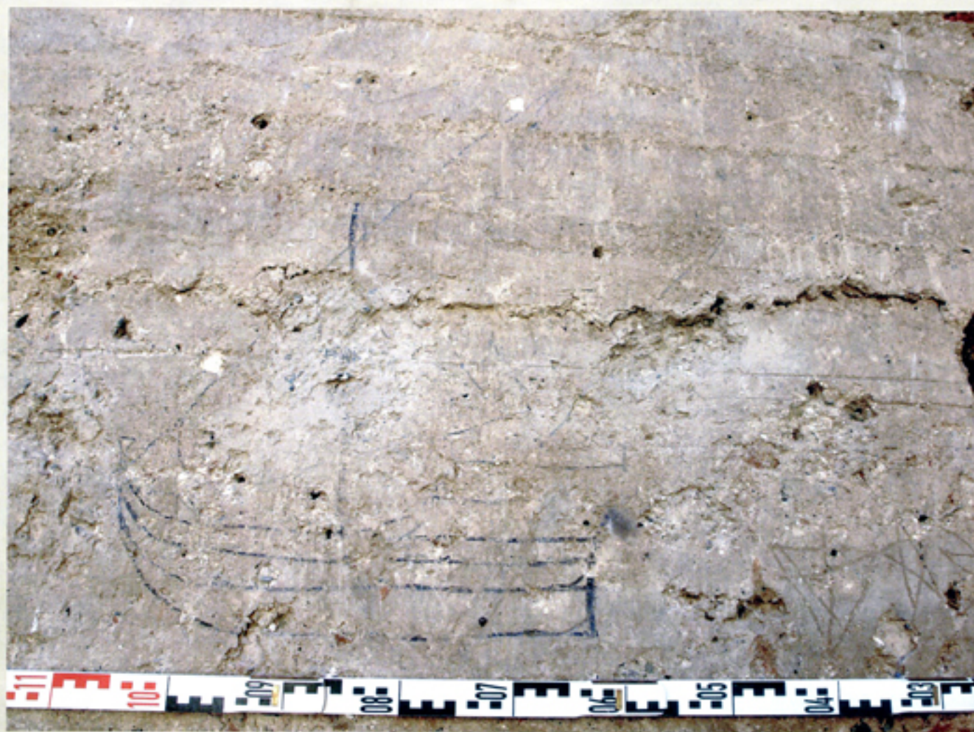
Carabela latina y estrellas en el Castillo de San Miguel de Almuñécar

“LA REPRESENTACIÓN DE FIGURAS CLÁSICAS Y SIMBÓLICAS DE LA ICONOGRAFÍA OCCIDENTAL CRISTIANA NOS CONFIRMA LA PARTICIPACIÓN DE CRISTIANOS CAUTIVOS EN LA CONSTRUCCIÓN DE LA MURALLA.”