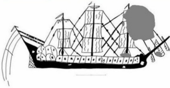
Fragata del Castillo de La Herradura (Almuñecar)

Se darán a conocer mediante numerosos ejemplos gráficos, qué son los grafitos históricos, el método empleado para su documentación y estudio, así como una clasificación temática de los principales ejemplos estudiados en la ciudad, en castillos de la costa granadina, en La Alhambra y el Generalife y por último se mostrarán algunos grafitos de tiempos de la Guerra Civil Española y del primer Franquismo.